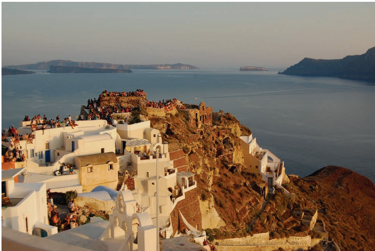
L'heure sacrée à Oia

Tout d'abord, il y a cette présence, juste en face de l'île. On l'appelle la caldera . Tous les regards convergent vers elle. Elle fascine, comme savent le faire les trous noirs de l'espace. Ici, après une éruption gigantesque, la mer s'est ouverte il y a 3'600 ans, engloutissant le supervolcan de Santorin.